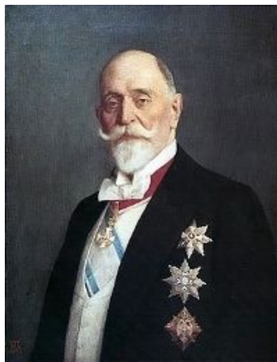
Sl. 1 Đorđe Vajfert

VSS je počeo sa radom 10. maja 1912-e godine, kada je u Beogradu predstavnik Vrhovnog Saveta Grčke svečano predao patent prvom "Grand Komanderu" Đorđu Vajfertu. Đorđe Vajfert, poznati predratni industrijalac i osoba od izuzetnog ugleda, najpoznatija je ličnost Srpske masonerije uopšte.