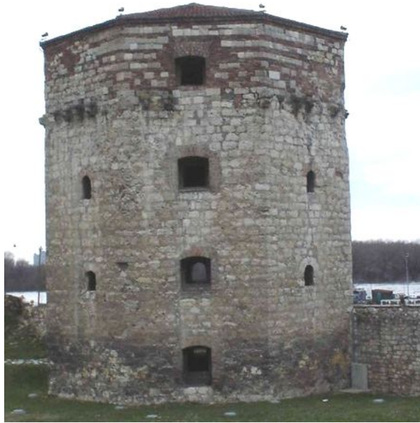
Nebojšina kula ispod Kalemegdanske tvrđave u Beogradu, u kojoj je Riga od Fere bio zatočen

Osman aga i turske vlasti u Beogradu, nameravali su da Rigu i drugove pošalju u Carigrad pa da mu sultan odredi kaznu. Međutim, bojali su se da će njegov prijatelj, Osman Pazvanoglu, koji se u međuvremenu odmetnuo od sultana, pokrenuti svoju vojsku i osloboditi ga 1 . Stoga su posle nekoliko nedelja zatočeništva Rigu od Fere i svih pet njegovih drugova zadavali u kuli Nebojši, a potom tela bacili u Dunav. Rigine poslednje reči bile su: Ja sam posejao bogato seme. Dolazi čas kada će moja zemlja brati slavno voće . Po njihovom pogubljenju, vlast u Beogradu namerno je širila glasine da su grčki patrioti pobešli i da su za njima čak upućene potere.