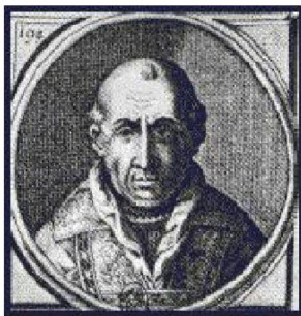
Papa Kliment V

Filip je prvo morao da osigura saradnju pape kome su, bar teoretski, Templari dugovali vernost i pokornost. U periodu od 1303. do 1305. godine, francuski kralj i njegovi ministri su izveli otmicu, a potom ubili papu, Bonifacija VII, a sasvim je moguće da su otrovali sledećeg, Benedikta XI. Potom je, 1305. godine, Filip uspeo da osigura izbor svog kandidata, nadbiskupa Bordoa, na upražnjeni papski presto, a novi prvosveštenik uzeo je ime Kliment V.