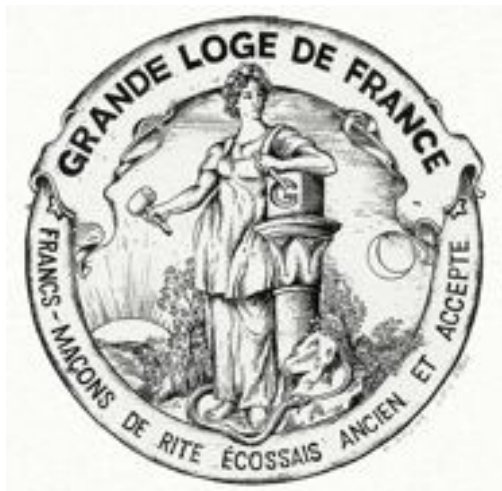
Slika 2: Amblem Velike Lože Francuske iz 1728-1894 godine.