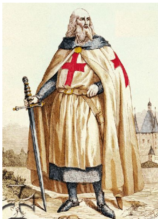
Žak de Mole

Najzad, 18. marta 1314, po naređenju Filipa IV Lepog, Žak de Mole, veliki majstor, i Žofroa de Šarne (Geoffroi de Charnay), preceptor Normandije, bili su spaljeni na lomači tihom vatrom. Njihovim pogubljenjem, Templari prividno nestaju sa istorijske pozornice. Ali uistinu, red nije prestao da postoji i o njima će se kasnije mnogo toga čuti.