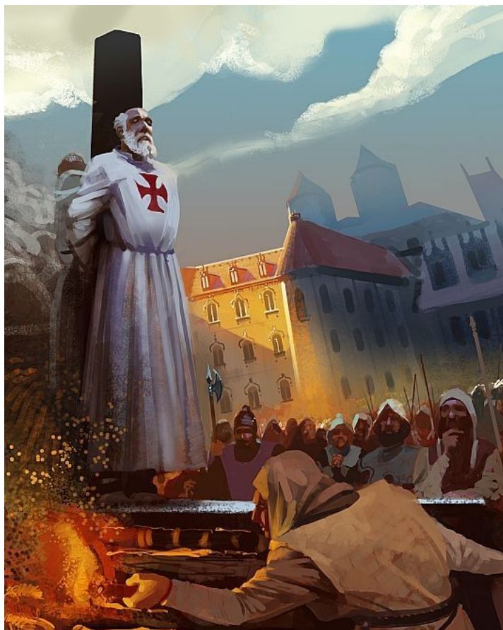
Spaljivanje Žaka de Molea (autor Karlos Fonseka)

Filip je pokušao da utiče na sveštenstvo da i dalje proganjaju Templare zbog jeresi, nadajući se da nijedan Templar, nigde u hrišćanskom svetu, neće biti pošteđen. Kraljeva revnost je u tom pogledu bila zaista iznenađujuća. Čovek bi možda mogao razumeti njegovu želju da se oslobodi prisustva reda u sopstvenoj zemlji, ali je manje jasno zašto je bio toliko odlučan u pokušaju da se Templari unište svuda u svetu. On sam svakako nije bio uzor vrlina; a teško je zamisliti da bi monarh koji je pripremio smrt dvojice papa bio iskreno uznemiren zbog povreda vere. Da li se Filip, jednostavno, plašio osvete ako bi red ostao netaknut izvan Francuske ili je nešto drugo bilo po sredi teško je reći.