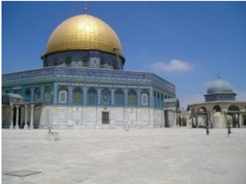
Omarova džamija u Jerusalimu

Prvi vojni red, Red siromašnih vitezova Hrista i Solomonovog hrama , poznatiji kao Vitezovi Templari , osnovan je 1118. godine, u vreme Prvog krstaškog rata sa ciljem da pomogne novom Jerusalimskom kraljevstvu da se odbrani od napada muslimana i da osigura bezbednost velikog broja hodočasnika iz Evrope koji su pohrlili ka Jerusalimu nakon njegovog osvajanja. Red je osnovao Ig de Pejen, a ime Templari potiče od imena njihovog istorijskog štaba u Omarovoj džamiji na Brdu hrama u Jerusalimu, koju su oni preimenovali u Templum Domini . Na jednom od njihovih pečata, predstavljena je struktura za koju se veruje da prikazuje ovaj hram sredinom 12. veka, i koja model po kome su napravljeni brojni templarski hramovi u Evropi, na primer Crkva hrama u Londonu.