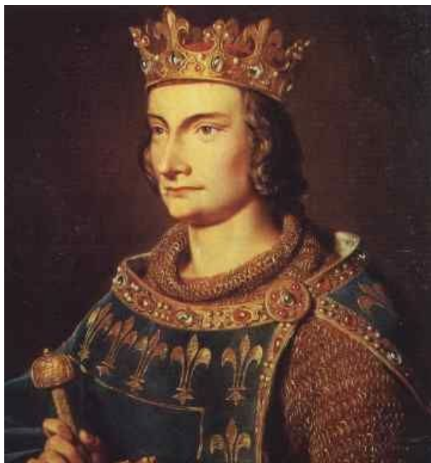
Filip IV Lepi (1268–1314) kralj Francuske iz dinastije Kapeta.

Pružali su i druge finansijske usluge, kao što su trgovina menicama, izdavanje vrednosnih pisama koja su se mogla unovčiti bilo gde u Evropi, izdavanje zajmova i drugo. Kamata na pozajmljenu sumu nije bila mala i kretala se od 11 do 15% što je izazivalo netrpeljivost dužnika. Templari su tako postali prvi menjači novca tog doba, a pariski templarski preceptorat je bio središte evropskih finansija. Verovatno je, čak, da je ček kakav mi danas poznajemo i koristimo prviput u praksu uveo ovaj red. Jedan od vladara koji je od Templara pozajmljivao velike sume novca bio je i francuski kralj Filip IV Lepi ( Philippe le Bel ).