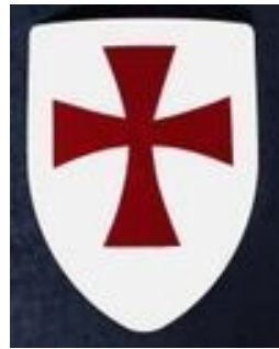
Templarski krst i grb Templara

Pružali su i druge finansijske usluge, kao što su trgovina menicama, izdavanje vrednosnih pisama koja su se mogla unovčiti bilo gde u Evropi, izdavanje zajmova i drugo. Kamata na pozajmljenu sumu nije bila mala i kretala se od 11 do 15% što je izazivalo netrpeljivost dužnika. Templari su tako postali prvi menjači novca tog doba, a pariski templarski preceptorat je bio središte evropskih finansija. Verovatno je, čak, da je ček kakav mi danas poznajemo i koristimo prviput u praksu uveo ovaj red. Jedan od vladara koji je od Templara pozajmljivao velike sume novca bio je i francuski kralj Filip IV Lepi ( Philippe le Bel ).