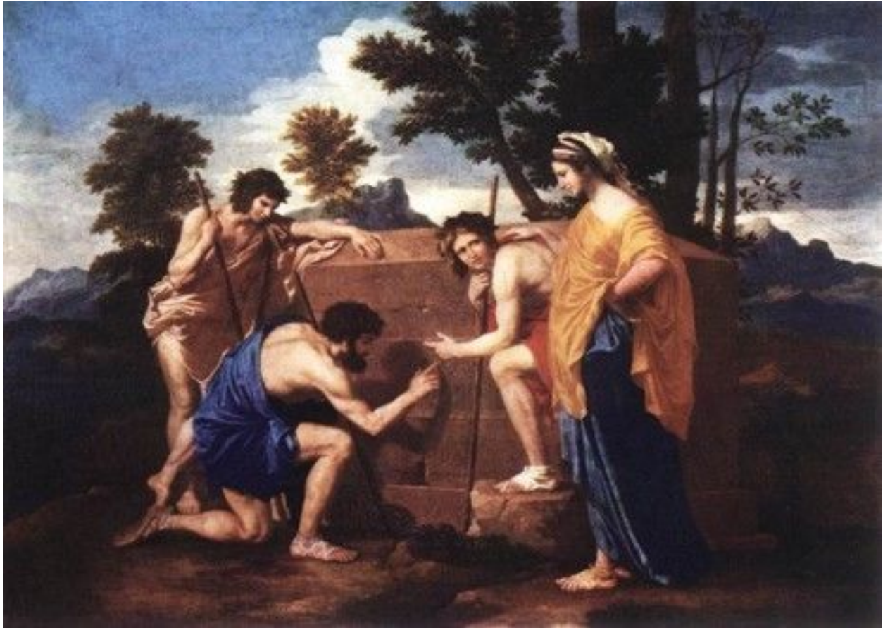
Slika 1: Arkadijski pastiri, Pusen, 1638 (Luvr)

Od posebnog interesa za nas je slika „Arkadijski pastiri“, ulje na platnu iz 1638 godine koje se danas čuva u Luvru, mada postoji i starija verzija ove slike istog autora iz 1627 godine sa istim naslovom koja se čuva u Londonu i muzeju Četsvort Haus.