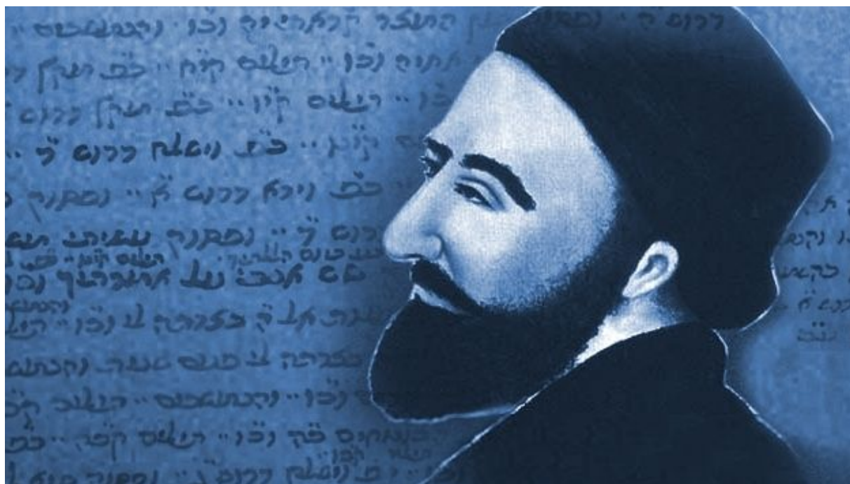
Sl 1. Kabalista Rav Isaac Luria

Bratska ljubav i milosrđe su stubovi i osnovni postulati slobodnog zidarstva. "Voli svog brata kao što voliš samoga sebe. Onaj ko kaže da je na Svetlu a mrzi svog brata, daleko je od Svetla". Posmatrani kao socijalne kategorije, ispunjavaju zadatak koji je slobodno zidarstvo preuzelo u cilju širenja ljubavi i mira u svetu.