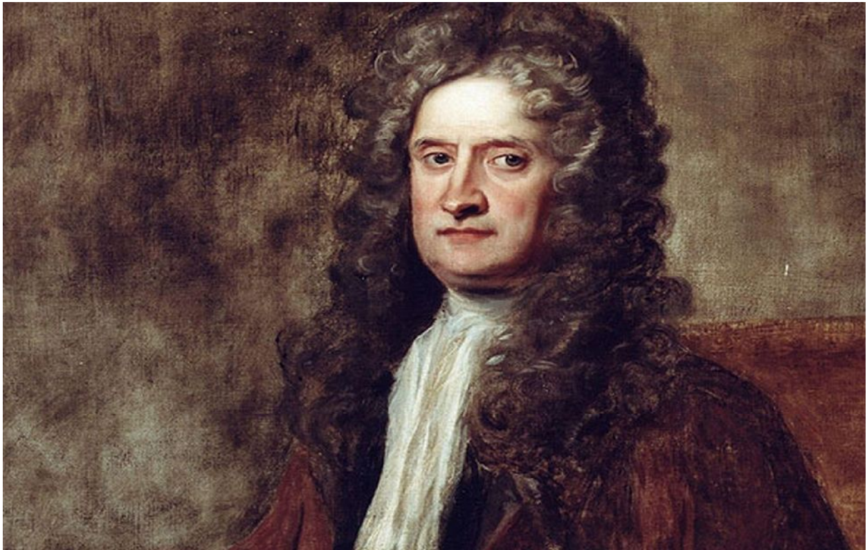
Sl 3. Ser Isaac Newton

Uzlazni put je predviđen planom Stvaranja i možemo ići kao do sada, težim, nesvesnim putem, putem ratova, patnji, mržnje, haotično, ili svesno putem Tore i Mitzvota. Torah znači pouka od strane Svetla, a Mitzvot je transformacija svake od 613 egoističnih želja u altruističnu. Naš život je tako programiran da je svaki događaj u njemu mogućnost za korekciju i učenje, iza svega stoji Misao Tvorca i ako svesno krenemo u korekciju naših namera, misli i delovanja možemo preskočiti čitav niz reinkarnacija duše i dostići u ovom životu ponovno spajanje sa Svetlom. Ceo naš život je velika lekcija, svaki pojedinačni događaj i osećanje su pouke koje nam Svetlost šalje, ma koliko teške i bolne ponekad izgledale. Radom na sebi, analiziranjem svake situacije, događaja i osećanja kroz prizmu lekcije i shvatanjem da iza svega stoji Misao Stvaranja, koja je čista ljubav, duhovno se uzdižemo. Promena naše želje za primanjem samo za sebe se reflektuje mnogo šire, na naše okruženje i celu ljudsku populaciju, tako da svaki čovek ima mnogo veću ulogu i odgovornost u evoluciji i ostvarenju druge faze plana stvaranja.