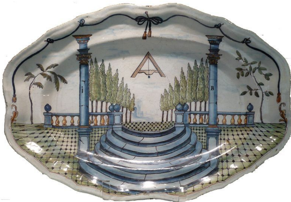
Слика 2. Посуда од фајанса са масонским украсима. Лион 18. век. Музеј Велике ложе Француске, Париз

За улазак у ложу плаћало се пет златника што је у оно време била значајна сума. За унапређење у други степен цена је била четири златника а у трећи један. У свим ложама тога времена иницирани је требао да узме назив витеза који је имао симболичко значење.