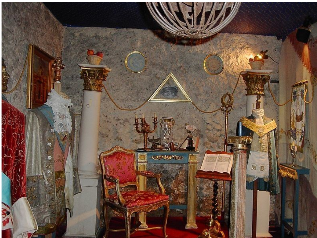
Слика 3. Масонски предмети из 18. века у замку Монженан, Жиронда, Француска

То је била историјска и религиозна ситуација у којој су се развијале Ложе у Европи. Свакако, папски утицај и антимасонско расположење знатно су се разликовали од земље до земље и у Француској, Енглеској и Прусији опасности су за масоне биле мање него у Риму или Мадриду.